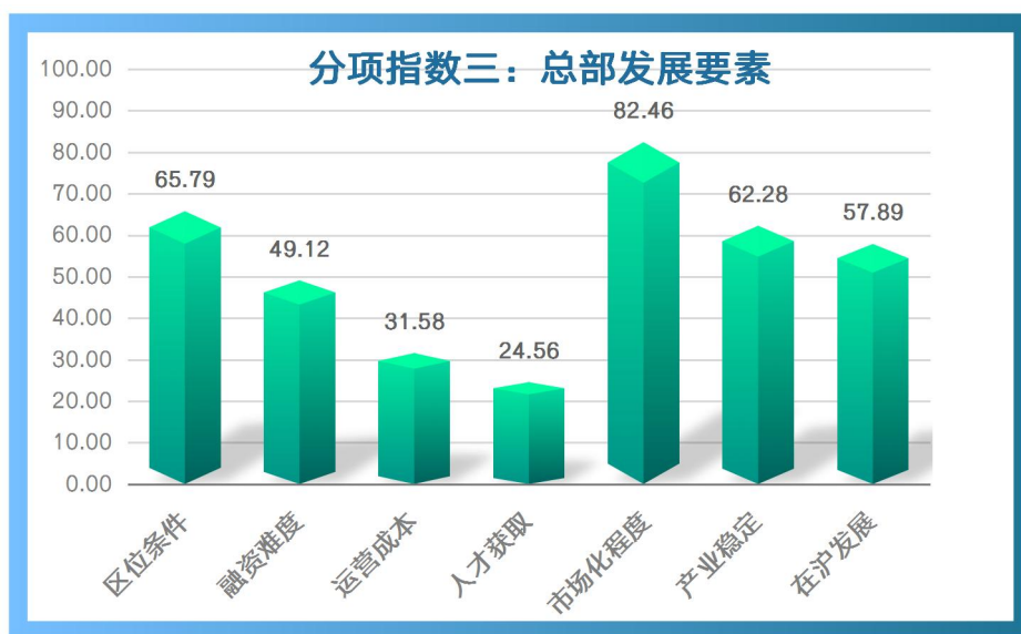
图 3：2023 年上半年“总部发展要素”具体指标情况

1. “人才获取”和“运营成本”是我市民营企业总部当前发展的重大阻碍。调查结果显示，我市民营企业总部在沪发展当前感受度最低的两项要素分别是人才获取（24.56）以及运营成本（31.58）。人才方面，受访企业中 56%表示招聘和留用核心业务岗位人员的成本增加，仅 5%的企业表示当前人才招聘和留用成本有所降低。运营成本方面，37%的企业表示上半年运营成本小幅上升，11%的企业表示公司运营成本迅速攀升。我市民营企业总部对人才的需求较大，但落户、医疗、教育等资源限制在极大程度上增加了企业的用工成本，尤其是地处郊区的制造业企业，用工难的问题更为明显。