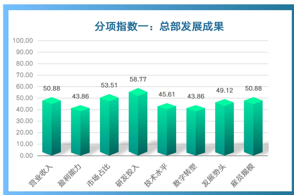
图 2：2023 年上半年“总部发展成果”具体指标情况

1. 我市民营企业总部市场营销总体稳定，但盈利能力呈现萎缩趋势。调查结果显示，2023 年上半年我市民营企业总部总体营业收入同比基本维持稳定（50.88）、市场占比仍处于向好状态（53.51），但营收变化冷热不均，整体营业利润呈现萎缩下行趋势（43.86）。在具体调查中，30%的受访企业上半年营收环