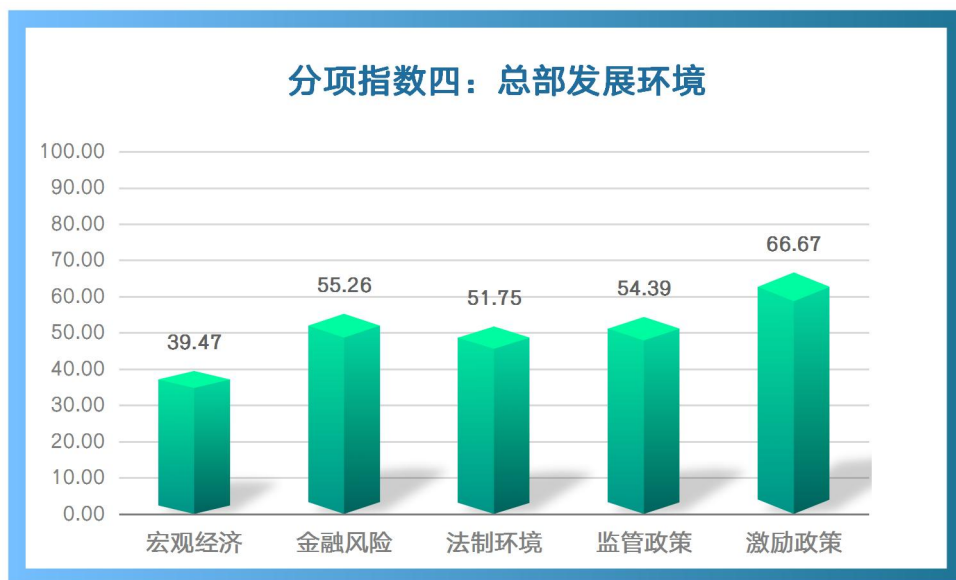
图 4：2023 年上半年“总部发展环境”具体指标情况